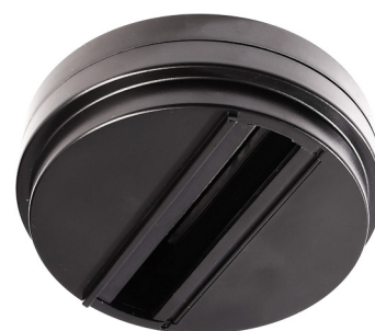
710047 Grafit schwarz graphite black

maximale Belastbarkeit 10 kg (100 N) / maximum load 10 kg (100 N) 220-250V/10A AC