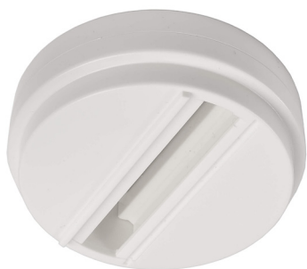
710045 Verkehrsweiß traffic white