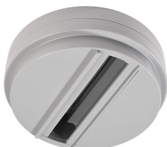
710046 Fenstergrau window grey